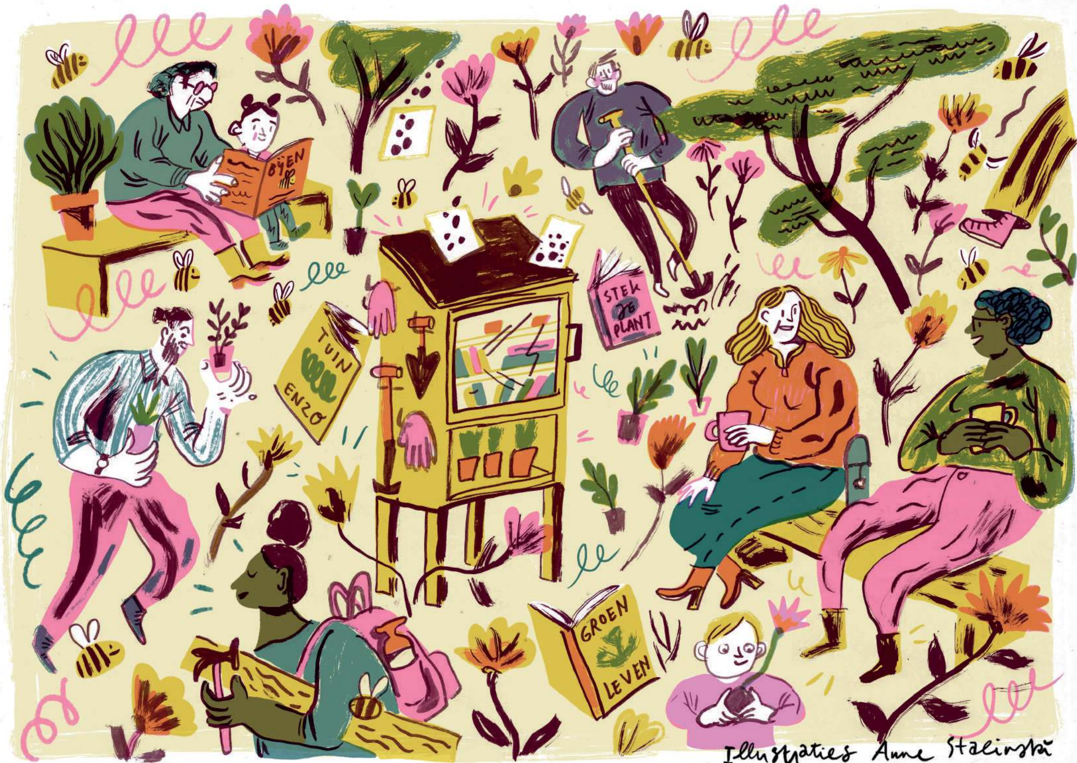
Illustraties Anne Stalinskä